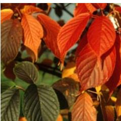
Omslagsbild: Bergkörbär, Prunus sargentii .